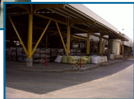
Planta Baterías MAC