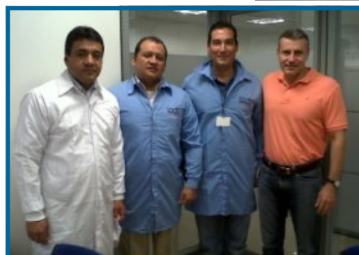
Planta Johnson & Johnson de Colombia